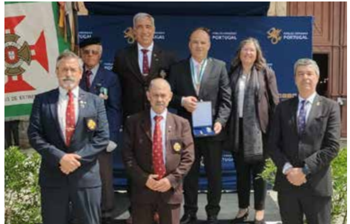
Presidente da Câmara Municipal de Estremoz foi agraciado com Medalha de Honra ao Mérito (Grau Ouro) pela Liga dos Combatentes, nas cerimónias comemorativas da Batalha de La Lys e do Dia do Combatente