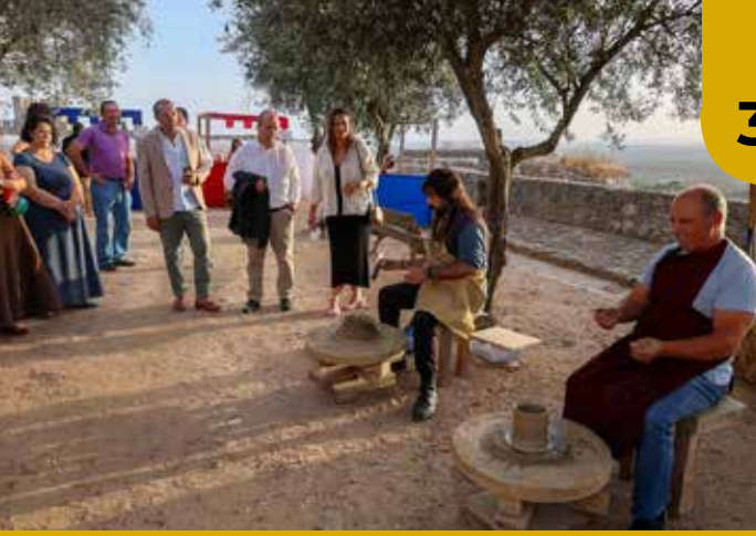
Encontro Nacional de Olaria, em Évora Monte, promovido pela ADOE, em parceria com o Município de Estremoz