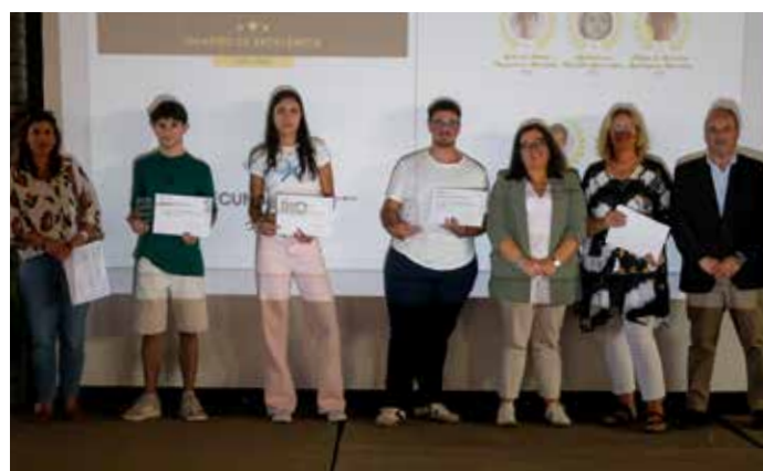
Entrega dos Diplomas do 12.º Ano e Prémios dos Quadros de Excelência e Valor 2024/2025, na Escola Secundária Rainha Santa Isabel