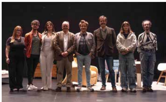
Espectáculo "O Marido do meu Marido"