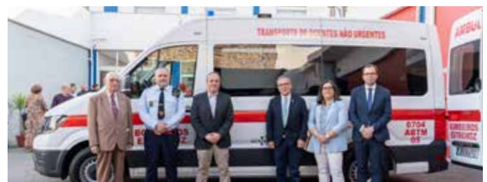
Município de Estremoz ofereceu nova ambulância aos Bombeiros Voluntários de Estremoz, num investimento de 67.025,00€

Na cerimónia de tomada de posse do novo Comandante do Corpo de Bombeiros Voluntários de Estremoz procedeu-se à oferta da nova ambulância de transporte múltiplo adaptada.