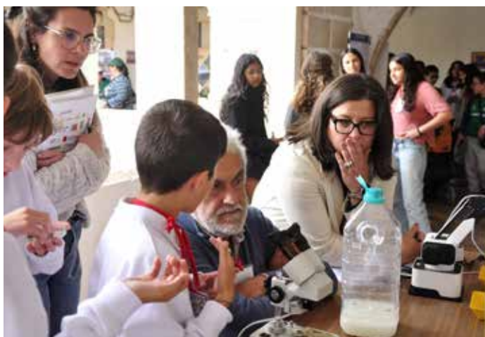
XVII Congresso Nacional Cientistas em Ação – Centro de Ciência Viva de Estremoz