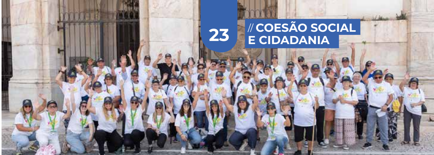
Caminhada de Sensibilização no âmbito do Eixo 3 do CLDS5G Transformamos+