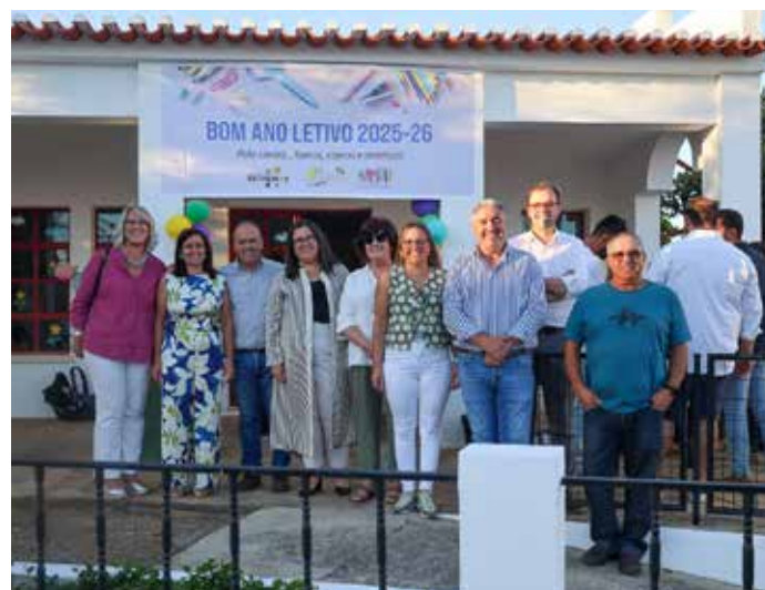
Reabertura da Escola de São Lourenço

Foi reaberta, após 14 anos do seu encerramento, a Escola de São Lourenço de Mamporcão, com a receção a 14 alunos.