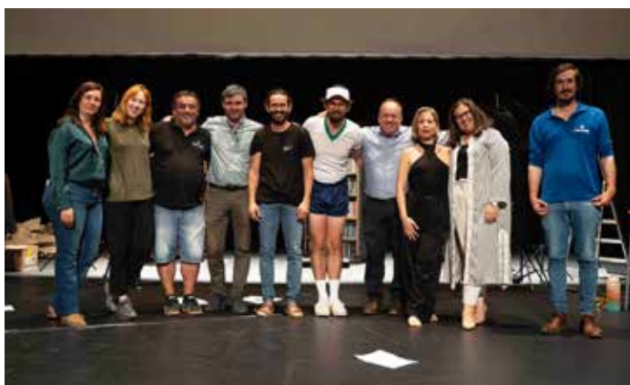
Espectáculo "A Novela"

O Colectivo Cultura Alentejo é uma companhia residente no Teatro Bernardim Ribeiro que, tem como objetivo, a formação artística e desenvolvimento cultural.