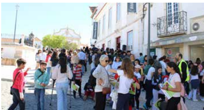
X PeddyBook no Dia Mundial do Livro

A Educação é a base da formação, principalmente das gerações mais jovens. É importante dar a conhecer aos jovens do concelho que existem oportunidades de crescimento no local onde residem. Queremos também trabalhar, de forma próxima, dando resposta às famílias a nível de Atividades de Enriquecimento Curricular (AEC), Atividades de Animação e Apoio à Família (AAAF).