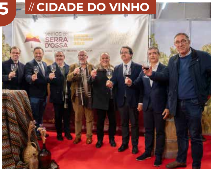
Cozinha dos Ganhões 2025