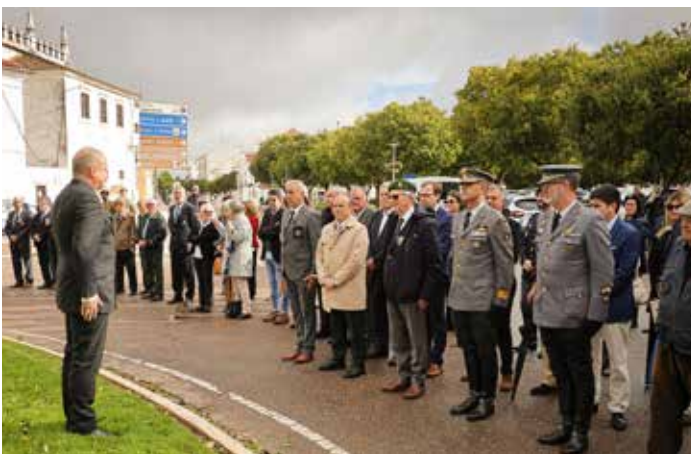
Município de Estremoz presente nas comemorações do 107.º Aniversário do Armistício e do 100.º Aniversário do Núcleo da Liga dos Combatentes de Estremoz