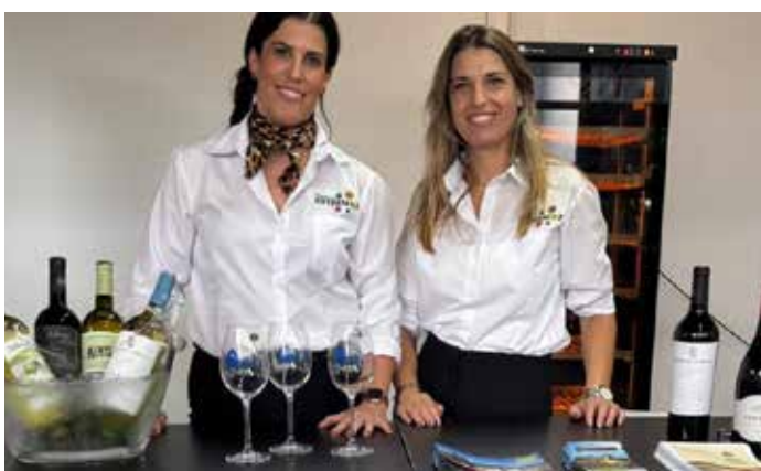
Festival Nacional de Gastronomia em Santarém