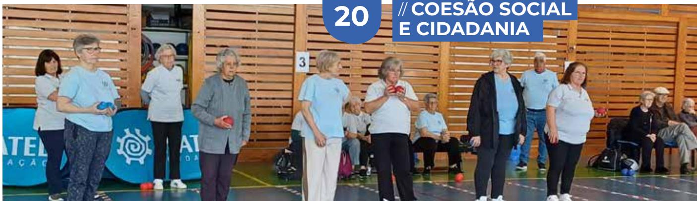
Estremoz presente na 3.ª etapa da Liga Boccia Sénior - Alentejo 2025