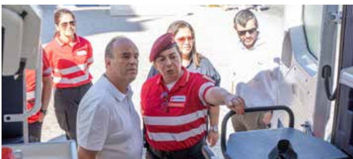
Município de Estremoz ofereceu nova ambulância à Cruz Vermelha de Estremoz, num investimento na ordem dos 80.000,00€