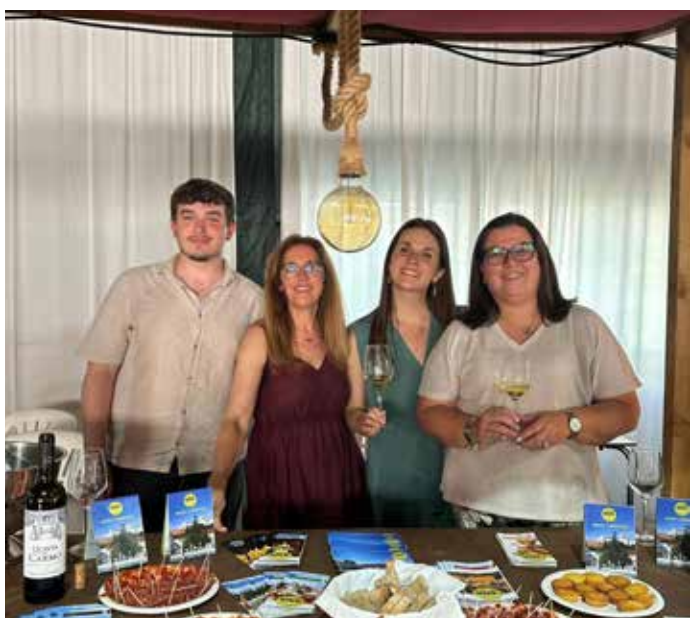
Feira Nacional de Agricultura em Santarém