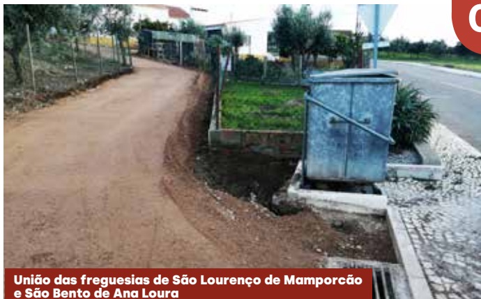
União das freguesias de São Lourenço de Mamporcão e São Bento de Ana Loura