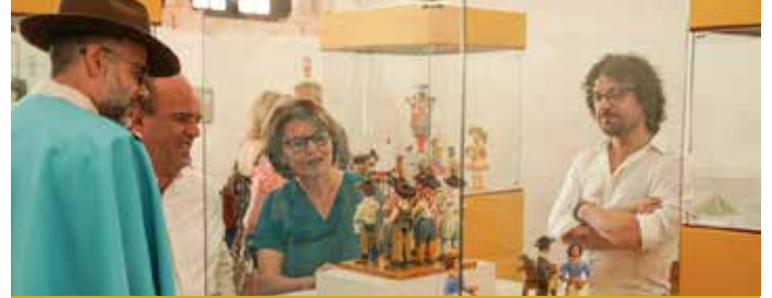
Exposição "Irmãs Flores, 50 anos em 50 bonecos"