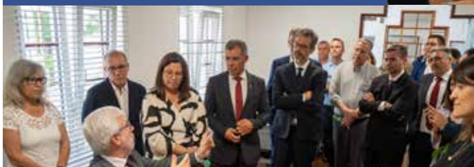
Inauguração do Espaço Cidadão na Sede da União de Freguesias de Estremoz com o Secretário de Estado da Digitalização e Modernização Administrativa, Mário Campolargo