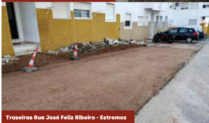
Traseiras Rua José Feliz Ribeiro - Estremoz