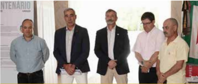
Exposição "Centenário Liga dos Combatentes"