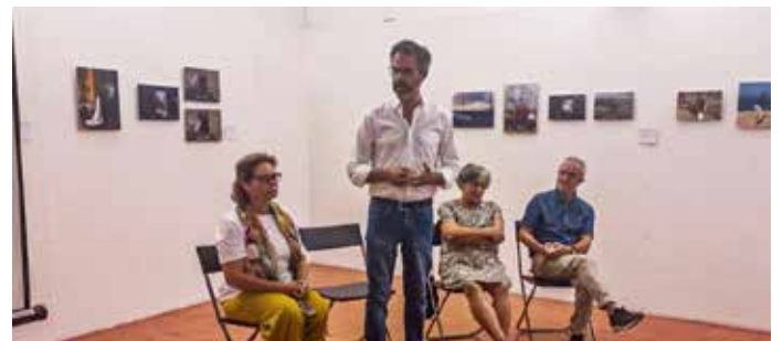
Exposição Fotográfica "In Limbo" de Carmem Serejo