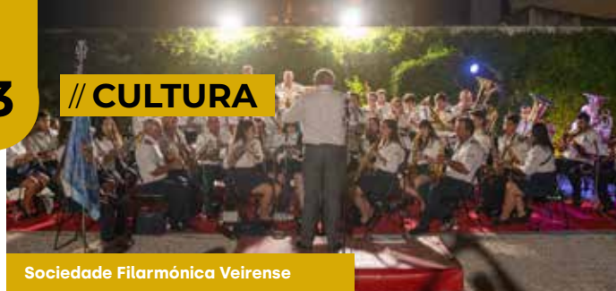
Sociedade Filarmónica Veirense