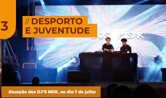
Atuação dos DJ'S MDK, no dia 7 de julho