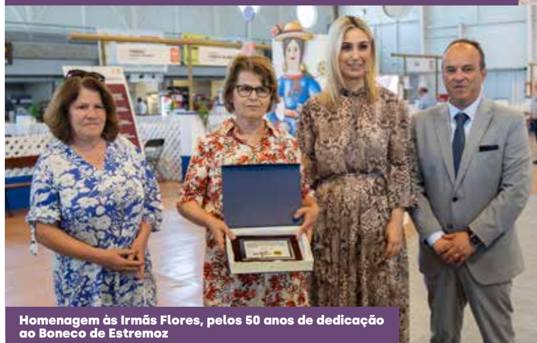
Homenagem às Irmãs Flores, pelos 50 anos de dedicação ao Boneco de Estremoz