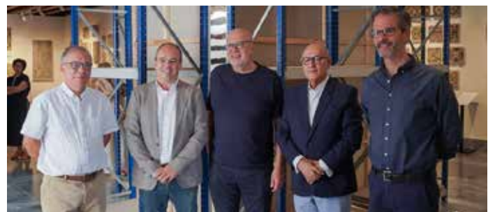
Obra "Clausura" de Pedro Calapez em Estremoz