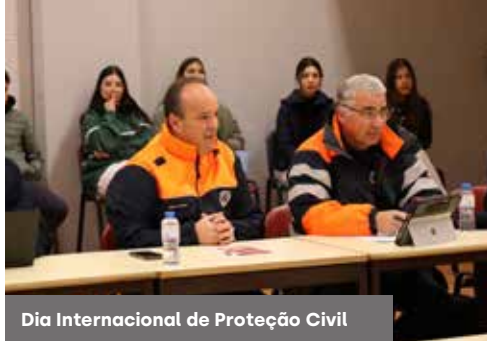
Dia Internacional de Proteção Civil