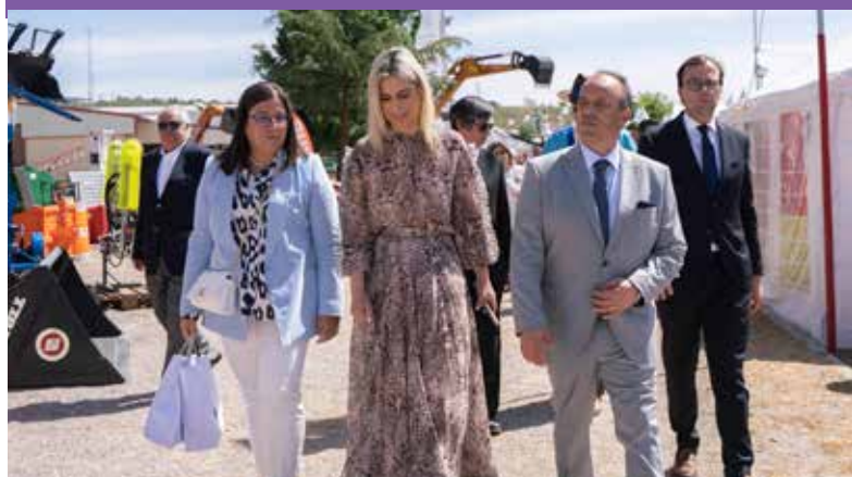
Cerimónia de inauguração com a presença da Sr.ª Secretária de Estado da Coesão Territorial, Professora Isabel Ferreira

Foram mais de 400 expositores numa dinâmica fantástica, num certame de entrada gratuita e entradas pagas apenas para os espetáculos.