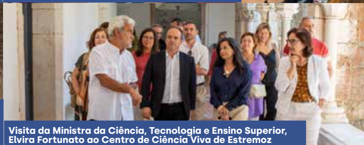
Visita da Ministra da Ciência, Tecnologia e Ensino Superior, Elvira Fortunato ao Centro de Ciência Viva de Estremoz