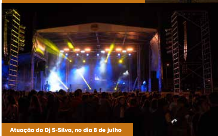
Atuação do Dj S-Silva, no dia 8 de julho

O cartaz foi de excelência e atraiu centenas de jovens ao Parque de Feiras e Exposições de Estremoz.