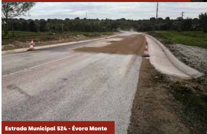
Estrada Municipal 524 - Évora Monte