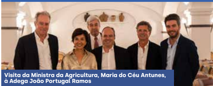
Visita da Ministra da Agricultura, Maria do Céu Antunes, à Adegas João Portugal Ramos