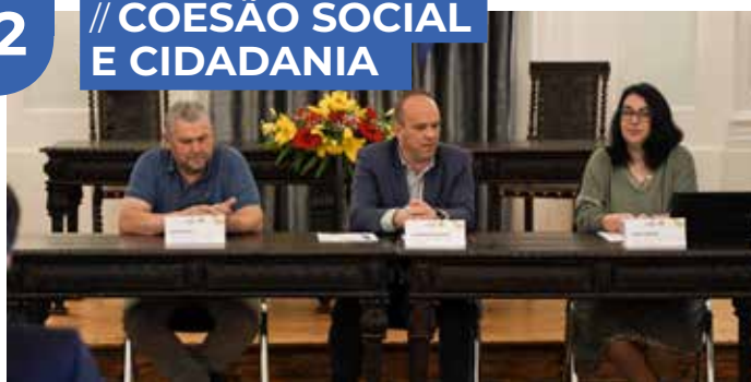
Município de Estremoz assinou protocolo de colaboração com o Serviço de Intervenção Precoce de Estremoz