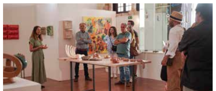
Exposição "Desconexa III"