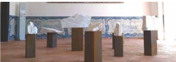
Exposição de escultura da autoria de Paulo Neves