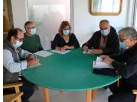
Simulacro na Residência São Nuno de Santa Maria