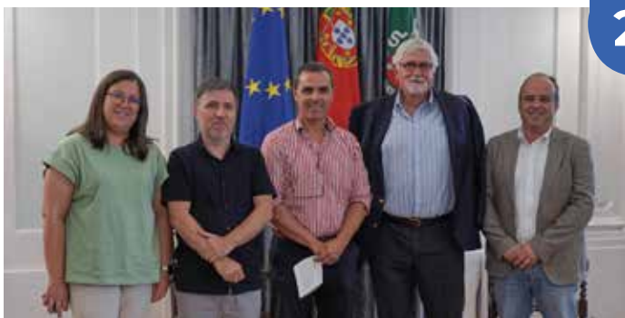
Sessão de encerramento do projeto POISE, promovido pela Fundação Romão de Sousa, no âmbito da Saúde Mental