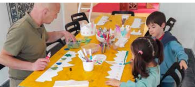
Cerca de uma Centena de Participantes na Atividade do Dia da Mãe Rainha, no Museu Berardo Estremoz