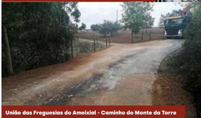
União das Freguesias do Ameixial - Caminho do Monte da Torre